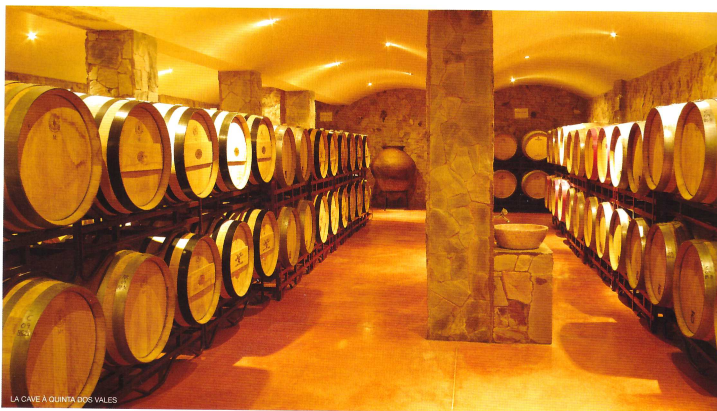
LA CAVE À QUINTA DOS VALES

Ceux d'entre nous qui aiment le vin portugais ont tendance à avoir une région préférée. Le Douro au nord, la première région vinicole démarquée dans le monde, est la favorite de la plupart des vrais connaisseurs, tandis que d'autres préfèrent les vins style Nouveau Monde produits aujourd'hui dans l'Alentejo, ou peut-être les vins plus élégants du Dão.