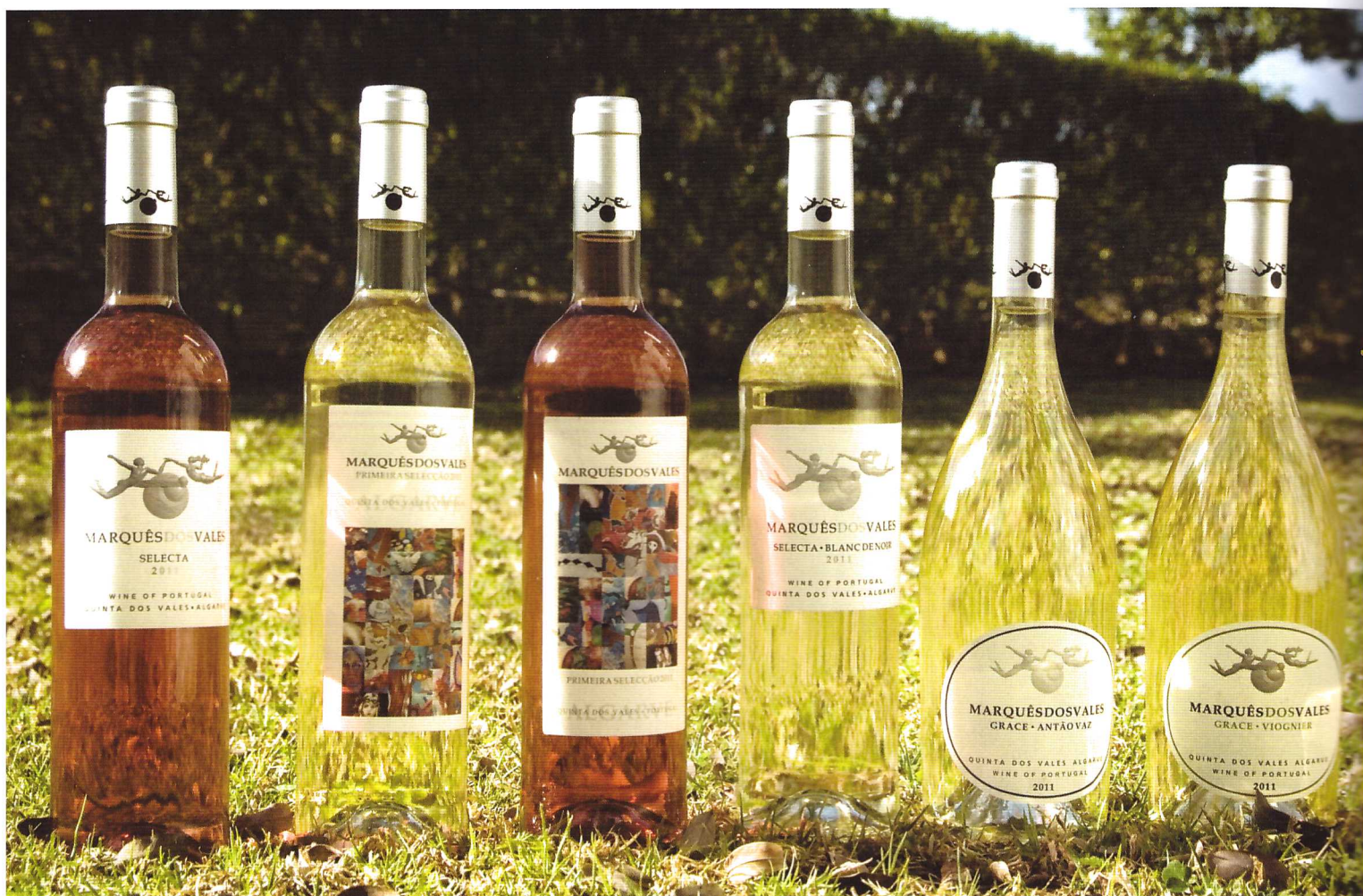
AU-DESSUS, UNE SÉLECTION DE VINS DE QUINTA DOS VALES, CI-DESSOUS, LE CHANTEUR CLIFF RICHARD À ADEGA DO CANTOR