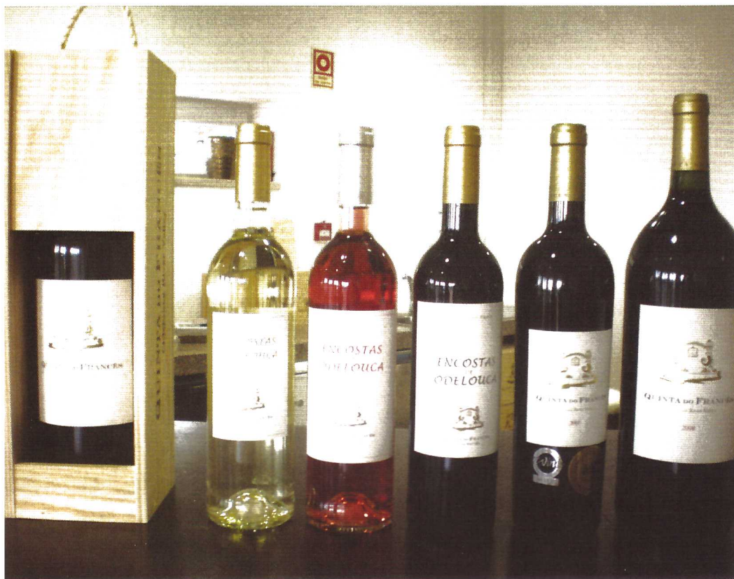
LES VINS DE QUINTA DO FRANCES